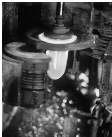
La magie de la précision : même la production de verre moderne demeure aujourd'hui fascinante

Les flacons ne sont toutefois pas les seuls à être perfectionnés. Un bécher de laboratoire ou une fiole Erlenmeyer peuvent également être améliorés. On peut par exemple renforcer l'épaisseur de leur paroi ou de leur bord supérieur. Le verre devient ainsi encore plus résistant et plus solide mécaniquement. De nouvelles géométries, des propriétés additionnelles ou des revêtements sont testés et développés, toujours en étroite relation avec les besoins exprimés par les clients. Depuis 2005, la proportion de nouveaux produits est passée de 0 à 6 %. Et les améliorations ne s'arrêtent pas là. Grâce à sa taille humaine, DURAN Group dispose de la flexibilité et la rapidité nécessaires pour répondre, dans les meilleures conditions, aux besoins des utilisateurs.