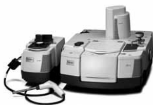
Spectromètre IRTF iS50

Historiquement, les marchés phares de l'offre Spectroscopie Thermo Fisher Scientific concernent la pharmacie, la chimie et les polymères, grâce notamment à sa position de leader en IRTF. Avec la gamme Proche IR, le Groupe a diversifié ses activités vers l'agroalimentaire et s'adresse aujourd'hui aux laboratoires de recherche, de contrôle ou d'essais, de tous secteurs.