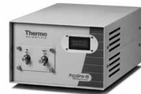
Spectromètre RMN picoSpin45